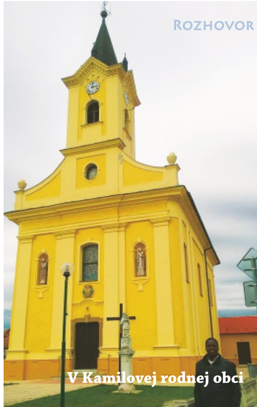
V Kamilovej rodnej obci

Všetko, čo som tu zažil a videl je pre mňa veľmi obohacujúce. Teraz už viac