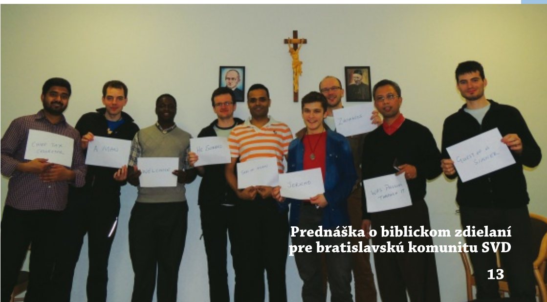
Prednáška o biblickom zdielaní pre bratislavskú komunitu SVD

rozumiem mojim európskym spolubratom. Ďakujem za možnosť prežiť jeden krásny týždeň na Slovensku. A ďakujem všetkým, ktorí ma sprevádzali a starali sa o mňa. Slovensko zostane v mojom srdci navždy.