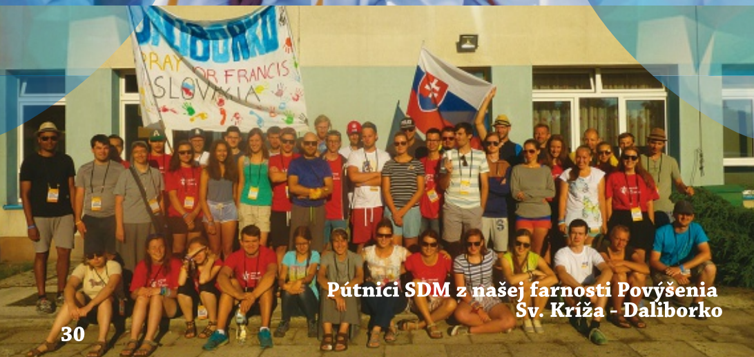
Pútnici SDM z našej farnosti Povýšenia Sv. Kríža - Daliborko