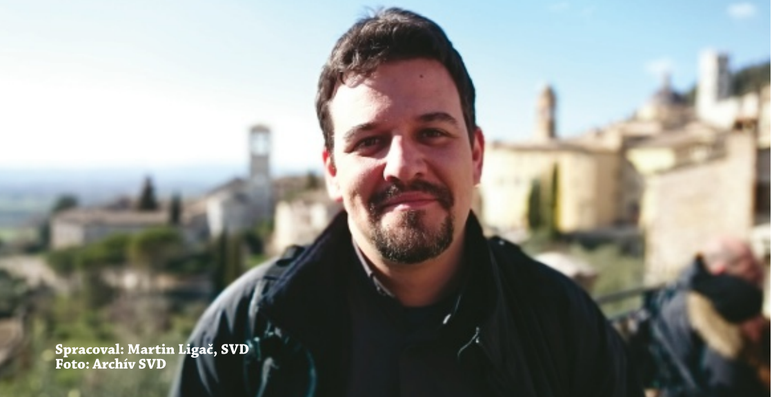
Spracoval: Martin Ligač, SVD