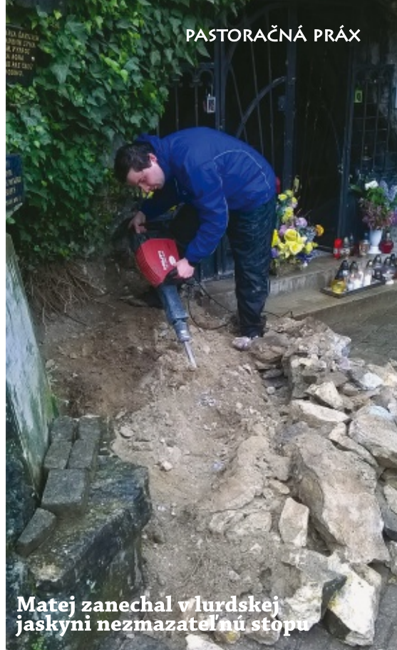
Matej zanechal v lurdskej jaskyni nezmazateľnú stopu

Obohatením boli pre mňa aj katechézy pre mladých pacientov v nemocnici, kde som u detí videl ich záujem o vyjasnenie si mnohých otázok ohľadom viery a ich túžbu po nájdení správnej životnej cesty. Povzbudením pre mňa boli aj mladí z Kalvárie. Vždy som obdivoval ich záujem o stretká, rozvíjanie duchovného života a taktiež ich príklad ochoty a obetavosti pomôcť pri rôznych akciách v misijnom dome. Počas biblických stretnutí s farníkmi sme sa venovali nielen meditáciám nad Svätým Písmom, ale spoznal som aj ich životné príbehy a krásu a hĺbku ich duchovného života. Taktiež bolo každé stretnutie zakončené pochutnaním si na výbornom koláčiku či rozhovorom o našich problémoch a radoostiach. Veľká vďaka patrí všetkým dobrým ľuďom, ktorých som stretol a ktorí mi počas celého roka neustále pomáhali. Teším sa zo všetkých skúseností, ktoré som tu získal. Určite ich využijem nielen počas mojej formácie ale verím, že o pár rokov aj v kňazskej službe.