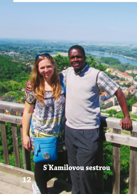
S Kamilovou sestrou