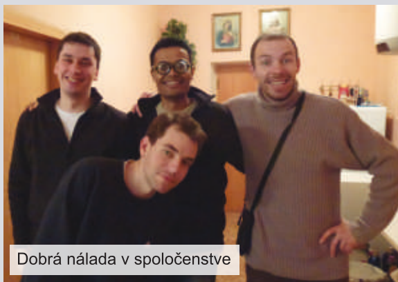
Dobrá nálada v spoločnosti

hesla: „Host do domu, Boh do domu.“ Ani jeden deň sme nehladovali. Bolo to priam biblické: tak ako Pán Ježiš nakrmil veľký zástup ľudí a zvýšilo 12 košov odrobín, tak aj títo milí ľudia nakrmili nás a ešte aj veľa zvýšilo. Tak skutočne medzi nami bol sám Boh. Večer sme sa spoločne ako jedna komunita bavili na spoločenských hrách, ktoré v Bratislave málokedy