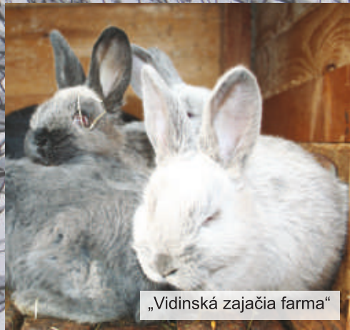
„Vidinská zajačia farma“