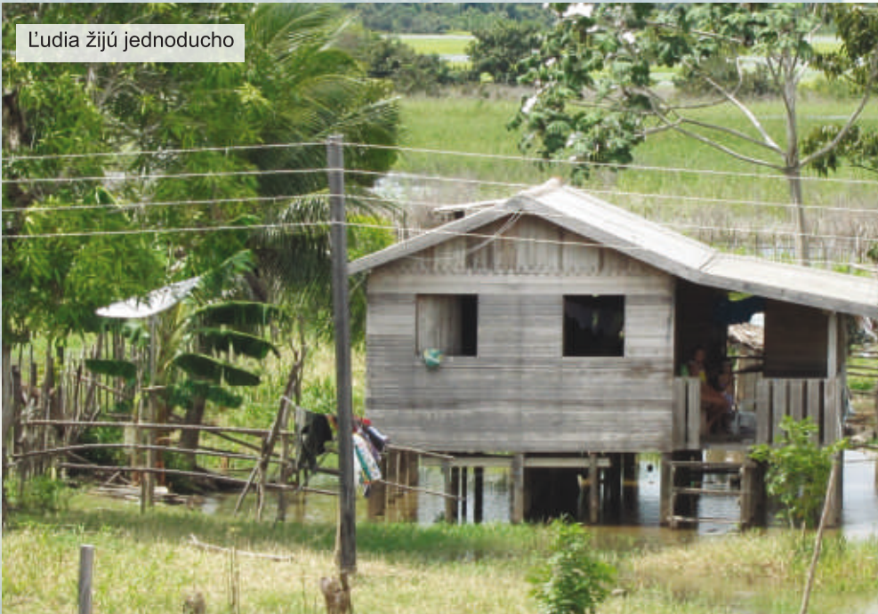
Ľudia žijú jednoducho

Iniciatíva v tomto prípade prichádza od ľudí. Zvyčajne bohoslužbu slova riadi koordinátor a, ako som spomenul, existujú ďalšie funkcie, medzi ktoré patria funkcie lektorov, žalmistov, vysvetľovateľov Svätého písma... Ako sami vidíte, nie je to vec len kňaza a kostolníka, ale celého spoločenstva. A ako má žalmista vedieť, čo a ako má spievať? Alebo ako má lektor vedieť, ako má čítať? Alebo pokladník, ako má viesť poklaničnú knižku? Alebo ako má vysvetľovateľ vedieť, ako najlepšie vysvetliť Sväté písmo a mnoho ďalších funkcií? Alebo ako má koordinátor vedieť, ako čo najlepšie viesť svoju komunitu? Pre tých všetkých organizujeme počas víkendu (spravidla sa začína v piatok a končí sa v nedeľu na obed) kurzy vo farnosti alebo v diecéznom centre. Nikto nemôže povedať, že to