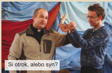
Si otrok, alebo syn?

Sobota tejto „víkendovky“ patrila už spomínanej akcii Ktosi Ťa volá. Keďže išlo o „víkendovku“, stretnutie sa začalo už v piatok. Bol to priestor, aby sme sa mohli lepšie spoznať, porozprávať sa a zamyslieť sa nad tým, aké miesto má modlitba v našom živote. Celé stretnutie duchovne viedol P. Igor SVD spolu so seminaristami. Sobotný deň sme strávili na už spomínanej akcii. Po návrate domov sme otvorene hovorili o našich zážitkoch a dojmoch. Záver dňa patril spoločenským hrám a pingpongovému turnaju. Mnohí z nás boli prekvapení z toho, že na úspech nepotrebujete ani pingpongovú raketu, ktorých bol pre veľký počet účastníkov nedostatok. Nedeľu sme svätili tak, ako sa patrí. Ráno pa-