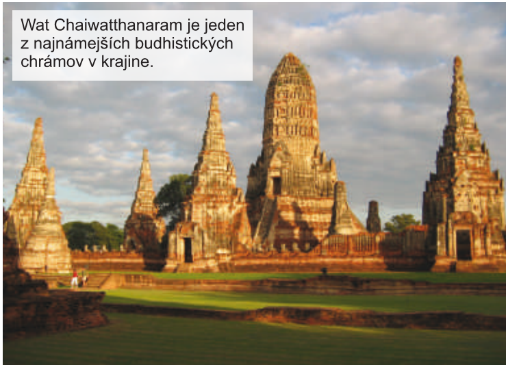
Wat Chaiwatthanaram je jeden z najnámejších budhistických chrámov v krajine.

Okrem viacerých misionárov, ktorí pôsobili v Thajsku, tu pôsobila v rokoch 1935-2003 aj slovenská misionárka ses-