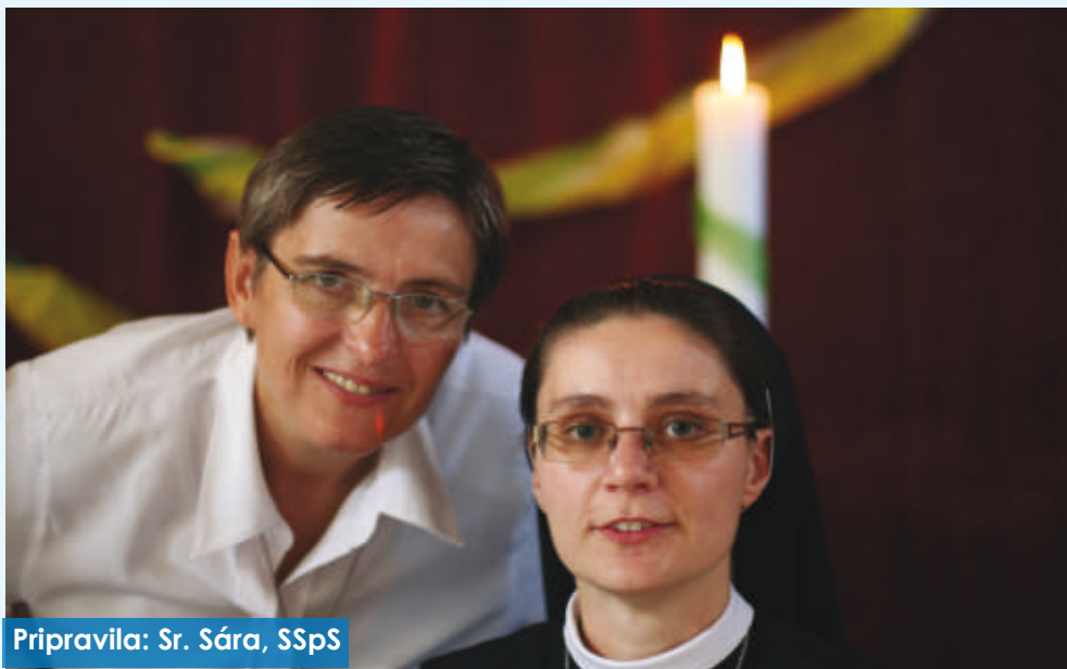
Pripravila: Sr. Sára, SSpS

P rechádzajúc ulicami centra hlavného mesta Slovenska sa často zamýšľam, čím sa líši život zasvätených ľudí od života ľudí, s ktorými sa denne stretávame na uliciach, v práci, v škole či v kostole... Asi málokto by si všimol, že kláštor misijných sestier je priamo v centre mesta. Nežijeme v typickej budove kláštora, ale v bloku, kde sa o spoločný vchod delíme aj s troma rodinami a viacerými firmami. Už len táto široká škála rôznorodosti hovorí o misijnom území – pre nás tak aktuálnom.