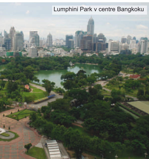
Lumphini Park v centre Bangkoku