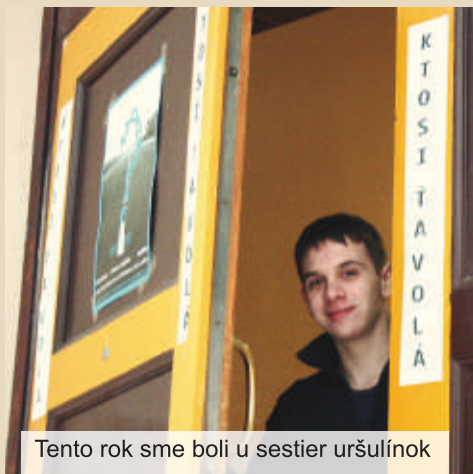
Tento rok sme boli u sestier uršulínok

„Prepáčte, je mi to trápne, ale zistil som, že mám povolanie.“ Toto boli slová chlapca, ktorý sa 16. februára 2013 rozhodol navštíviť už 8. ročník akcie s názvom Ktosi ťa volá, ktorá sa po prvýkrát konala v priestoroch Gymnázia sv. Uršule v Bratislave. Jeho nerozhodnosť a ustráchanosť zaujali okoloidúceho starého pána, ktorý išiel vrátiť do obchodu fľašku od piva. Porozprával chlapcovi svoj životný príbeh a odporučil mu, aby svoje povolanie nestratil a nepremrhal, a aby pamätal na to, že mladosť je stvorená pre hrdinstvo. Samozrejme, nešlo o skutočnosť a skutočné postavy, ale o scénku, v ktorej spojili sily mladí rehoľníci, aby poukázali na dôležitosť životného rozhodnutia, rozhodnutia sa pre povolanie. Vyše sto mladých ľudí sa už pred začiatkom mohlo tešiť