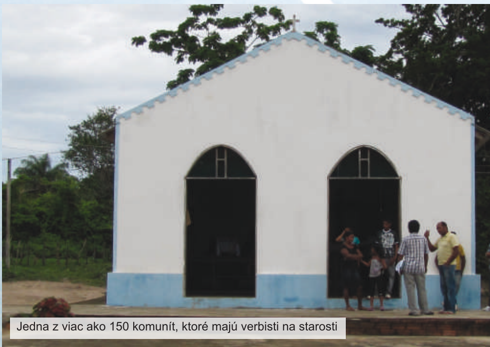
Jedna z viac ako 150 komunit, ktoré majú verbisti na starosti

na mieste. Región cesta je rozdelený na A a B. A je do 80 km od mesta a B je zvyšok. Ďalej sú tieto regióny rozdelené na subregióny, čo v praxi znamená, že 5 komunit, po slovensky filiállok, sa zlučuje do podmnožiny, ktorá má svoje meno – svojho patróna. Takže v takom regióne A máte približne 20 subregiónov. Každý kostol má svojho patróna, každý subregión má svojho patróna i región má svojho. Celá naša farnosť má patróna sv. Antona Paduánskeho. Hotová matematika. Zdá sa to zložité, ale keby to tak nebolo zorganizované, farnosť by nefungovala. Ja som dostal do daru v meste štyri komunity – kostoly – a mimo 28. Pýtate sa, aké veľké sú teda tie komunity? Mesto je ako vždy klasika. Veľké kostoly, návštevnosť je primeraná veľkosti kostola. Mimo