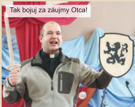
Tak bojuj za záujmy Otca!

trilo modlitbe, zamysleniu a slávnostnej svätej omši. Po dobrom nedeľnom obede sme sa povzbudení rozišli naspäť za svojimi povinnosťami a starosťami. Celého stretnutia sa zúčastnilo asi 20 chalanov z rôznych častí Slovenska, z východu i západu, ba prítomní boli dokonca i hostia „z ďalekej“ Moravy pod vedením fr. Milana SVD, ktorý tam