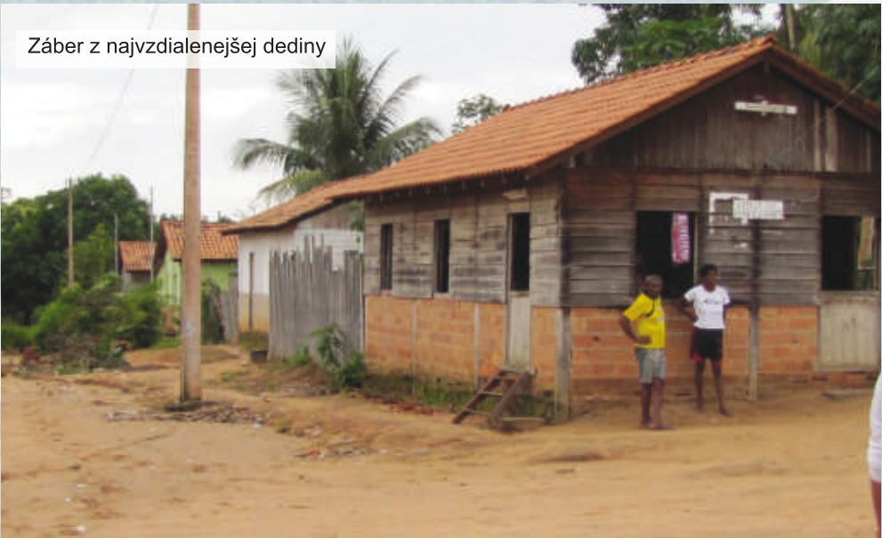
Záber z najvzdialenejšej dediny

Tolko teda v krátkosti zo života na misii v Amazónii. Želám čitateľom Mladého Misionára veľa Božieho požehnania a milosti.