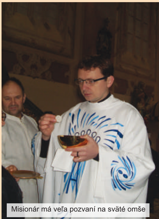
Misionár má veľa pozvaní na sväté omše