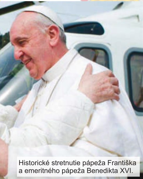
Historické stretnutie pápeža Františka a emeritného pápeža Benedikta XVI.