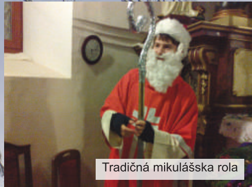
Tradičná mikulášska rola

Pri tom všetkom zakúšame, aký pozhnaný čas je náš noviciát. Sme zaň vďační Bohu i Vám všetkým, ktorí na nás myslíte!