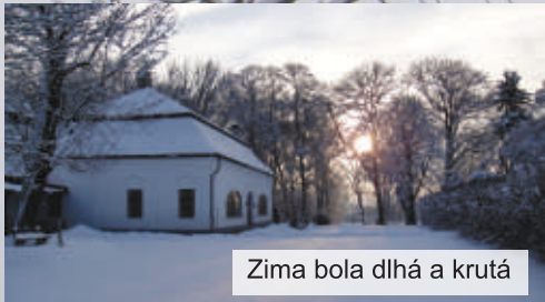
Zima bola dlhá a krutá