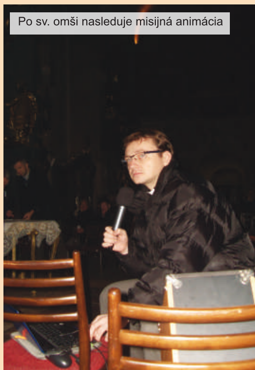
Po sv. omši nasleduje misijná animácia