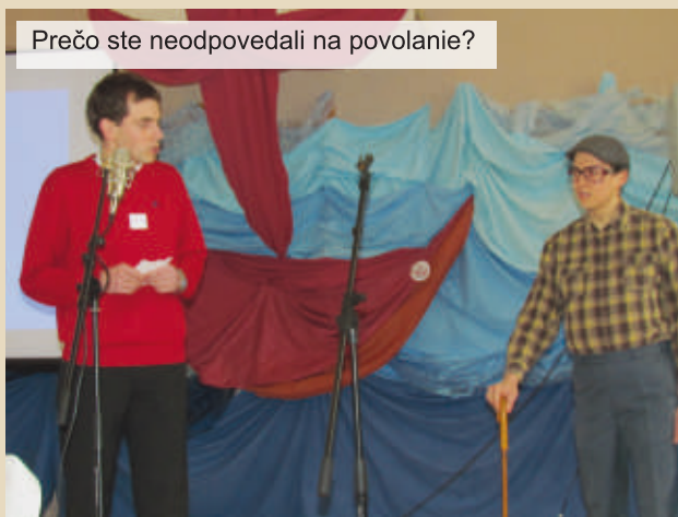
Prečo ste neodpovedali na povolanie?